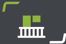
Balkone & Laubengänge