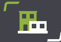
Dächer & Bauwerksabdichtungen